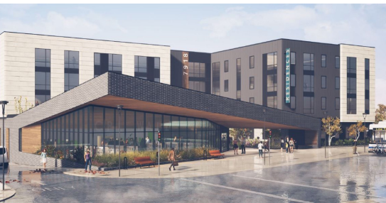
Karam Senior Living - unfinished designs

Puedes encontrar recursos adicionales en dscdo.org/coronavirus .