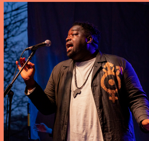
Church of Starry Wisdom

Presentado por la Organización de Desarrollo Comunitario de Detroit Shoreway (DSCDO) en colaboración con Cleveland Public Theatre.